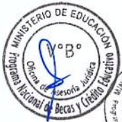
Sandro Luis Parodi Sifuentes Director Ejecutivo Programa Nacional de Becas y Crédito Educativo - PRONABEC